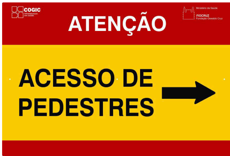
3 PLACA PEO-06