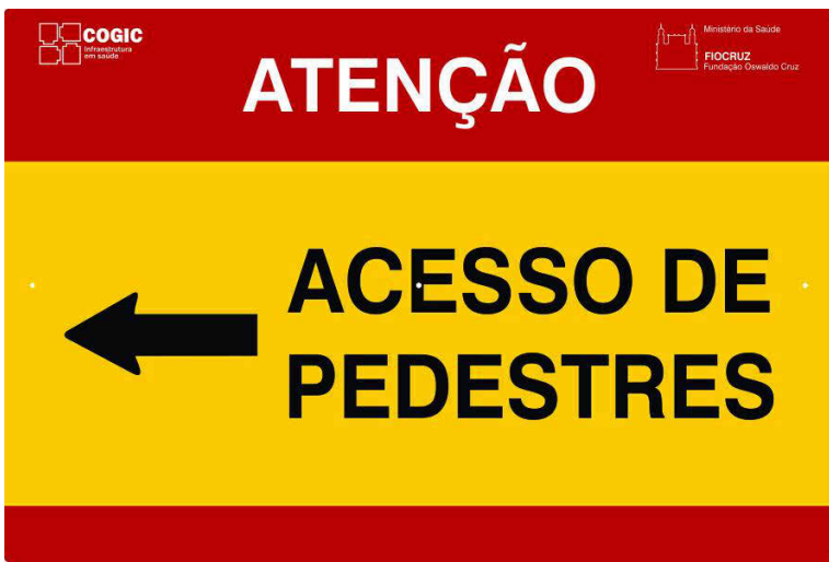
4 PLACA PEO-07