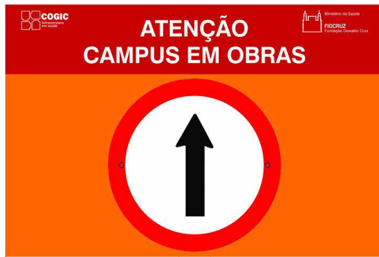
5 PLACA PEO-12