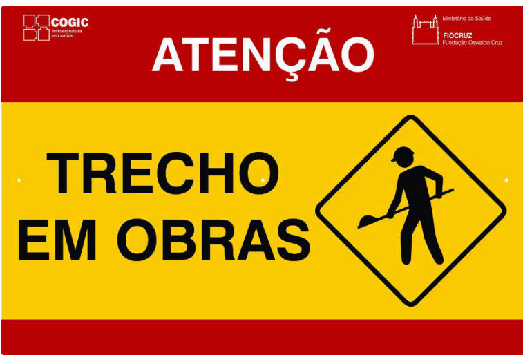
2 PLACA PEO-04