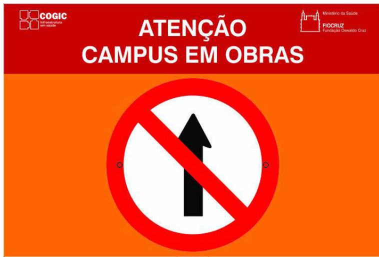
6 PLACA PEO-14